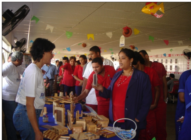
Recreadores da Reciclar fizeram a animação da festa e a Feira de produtos reciclados atraiu interesse dos funcionários

E comemoração ao Dia Mundial do Meio Ambiente - festejado no dia 15 de junho -, a Tintas Iquine realizou, no último dia 17 de junho, em parceria com a empresa Reciclar Gerenciamento de Resíduos, um encontro de conscientização sobre a importância da reciclagem de lixo.