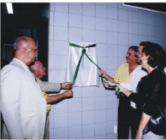
Descerramento da placa marcou inauguração da Casa do Residente

Com o objetivo de oferecer uma área de convívio, dotada de uma infraestrutura voltada para o estudo e o lazer dos profissionais que fazem residência no hospital, o IMIP inaugurou, no dia 10 de junho, a nova Casa do Residente.