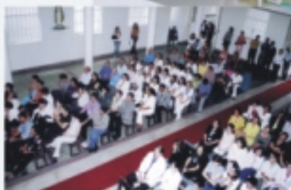
Missa reuniu amigos do IMIP