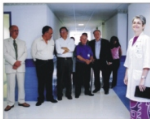
Autoridades prestigiaram inauguração