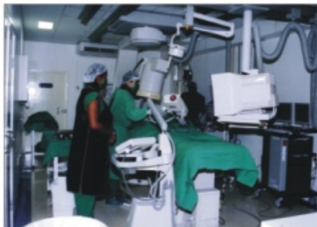
Procedimentos radiológicos são realizados no novo serviço do IMIP

tica, o serviço de Radiologia e Cardiologia Intervencionista também permite o tratamento dos pacientes. Todos os procedimentos são realizados com intervenção mínima no organismo e podem ser aplicados em quase todos os órgãos do corpo, sem a necessidade de submeter o paciente a cirurgias traumáticas. "Em casos de cirurgia, por exemplo, o paciente tratado pelo método intervencionista não recebe anestesia geral e passa pouco menos de 48 horas no hospital. Pelo método tradicional, esse período se elevaria para pelo menos