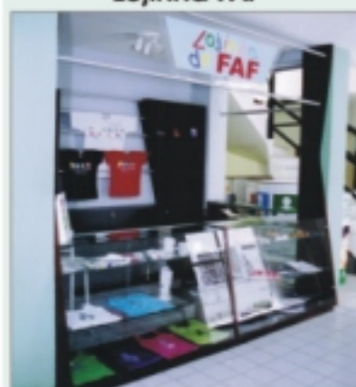
Venda de produtos da Grife IMIP

De 6 a 10 de junho, a Lojinha da FAF esteve presente na sede do SEBRAE, divulgando os produtos da Grife IMIP e vendendo as camisetas-ingresso para o São João Amigos do IMIP. Além dos pontos-fixos nos Shoppings Guararapes e Boa Vista, a lojinha da FAF esteve ainda, no colégio Mazzarello, na Várzea, no período de 1 a 7 de junho.