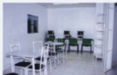
Casa do Residente do IMIP