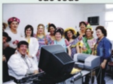
Voluntárias comemoraram São João no IMIP

O voluntariado comemorou o São João com os pacientes do IMIP, no dia 15 de junho. Para o festejo, as voluntárias vestiram-se de matutas e levaram o forró às enfermarias do hospital. Na ocasião, foi feita a divulgação da camisa do Forró Amigos do IMIP, que aconteceu no dia 17 de junho, no Clube Internacional do Recife.