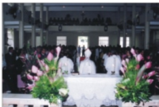
Capela esteve lotada na homenagem ao IMIP

Durante a celebração, o arcebispo ressaltou a importância do Prof. Fernando Figueira, como fundador do IMIP e responsável pelo caráter solidário da Instituição, que trabalha em prol das mulheres e crianças carentes do Estado de Pernambuco. A solenidade contou ainda com a participação do Coral do IMIP, formado por funcionários do IMIP. Com muita alegria e emoção, o Coral comemorou o quinto ano de existência do grupo, que realiza apresentações em diversos eventos da Instituição.