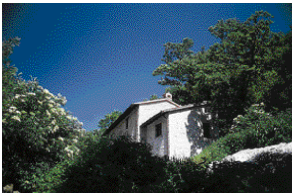
Rifugio Pieja- Pieja di Pianello di Cagli