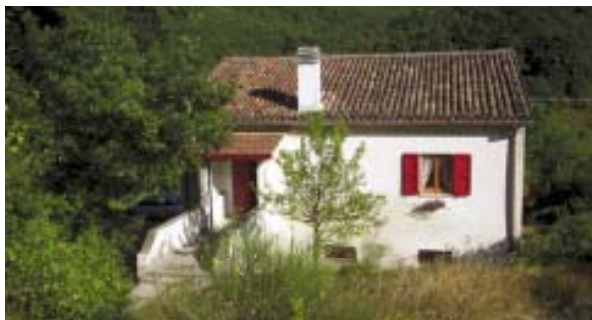
Rifugio Chi Zanchi - Apecchio