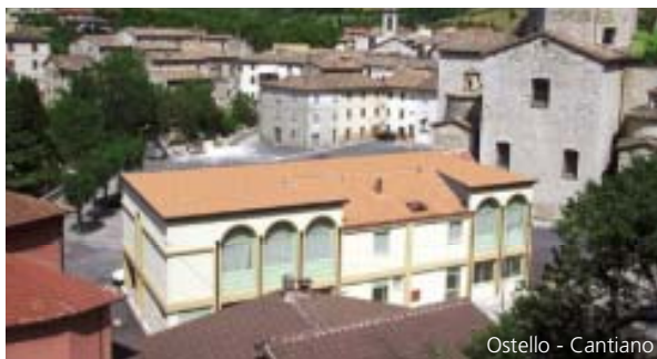
Ostello - Cantiano

Per informazioni e prenotazioni: 0721 700224 • 335 1230615