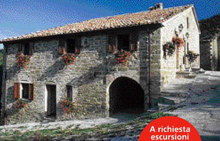
Casa vacanze La Chiusura - Apecchio

Ampie possibilità: autogestione o pensione completa