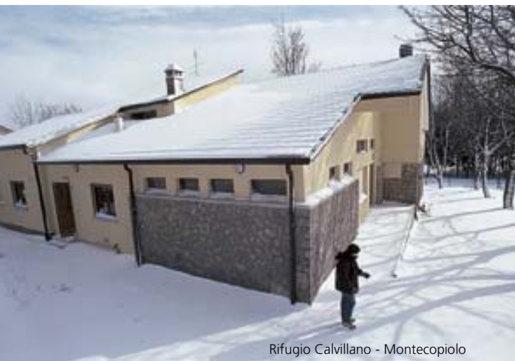
Rifugio Calvillano - Montecopiolo

Le nostre case, ostelli e rifugi sono strutture discrete, immerse nel verde del luohi più boscosi delle Marche, sui dolci fianchi delle montagne del Montefeltro. Sono dotate di ogni comfort e complete in ogni dettaglio. Adatte a famiglie, singoli o gruppi anche numerosi, grazie alla presenza di spazi ricreativi, sia interni che esterni.