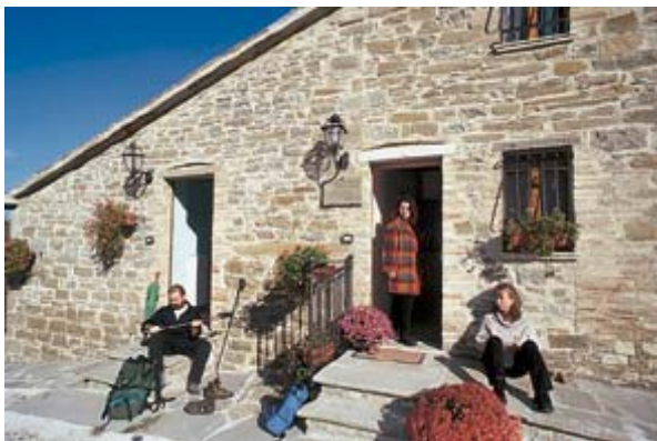
Casa vacanze La Chiusura - Apecchio