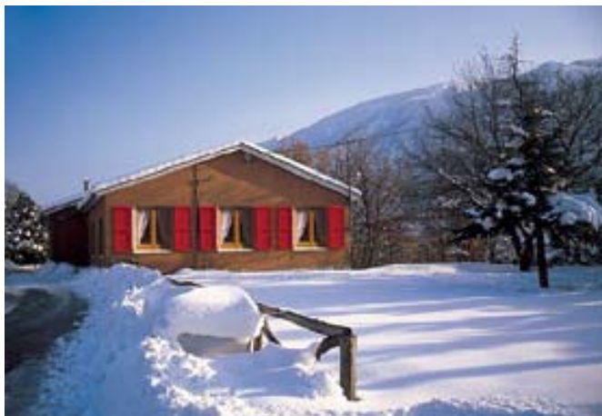
Rifugio CEA di Piobbico