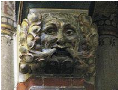
Groene Man, Driehuis- Westerveld

Het is de belangrijkste hoek- steen van ons Pelgrimsoord.