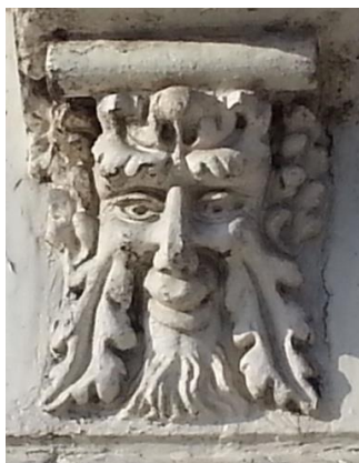
Groene Man, Amsterdam

hebben al genoeg inzicht om dit in principe met „ja“ te kunnen beantwoorden. De logica brengt ons vervolgens naar ziekten als kanker. Dat „gedachten“ ook kanker kunnen genezen mag in sommige (zeldzame) gevallen waar zijn. In het algemeen zal dit een illusie blijken. Zij staan namelijk op een lager energetisch niveau als het DNA. Het Absolute Niets daarentegen, als de Ultieme Dimensie die het hele Universum afbreekt en weer opnieuw doet ontstaan – niet een keer, maar continu – is het enige dat realistischerwijze hoop kan geven. Dit alles wordt nu KOSMISCHE (MOEDER) HEALING genoemd. Door overgave aan het Bodemloze Kosmische Niets – gesymboliseerd door de Zwarte Madonna – belooft Zij genezing op alle niveau's. Het is het centrale gebeuren in ons Pelgrimsoord.