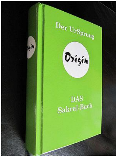
Sakraal Boek „Origin“