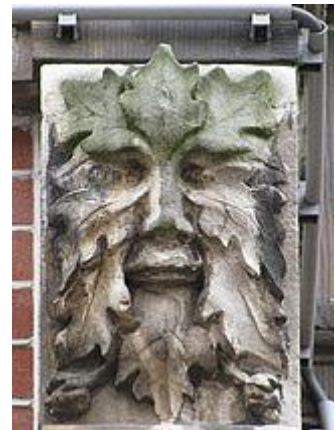
Groene Man, Haarlem

Tot slot: Onze shop met allerlei hooginteressante artikelen.