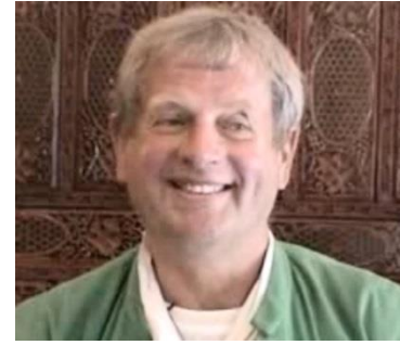
Teaching 2006 Hollywood USA