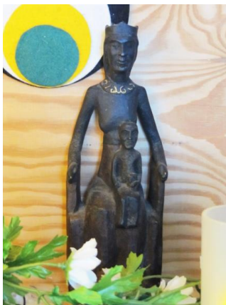
Zwarte Madonna van Rocamadour Frankrijk/Huisaltaar