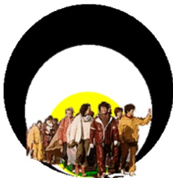
Pelgrimage naar de Kosmische Moeder

Hellenistische Mysterien zijn op dit inzicht gebouwd. Daar ging de adept de „Kosmische Schoot“ (Isis, Demeter) binnen om door overgave van zijn ego opnieuw geboren te worden. Op dezelfde manier ontstaat uit het Niets het Eeuwige Licht/het Goddelijke. „God“ is dus niet de „Vader“ maar de „Zoon“ (van de Moeder!). Opnieuw een verrassing: De manifestatie van de Oorspronkelijke Moeder-Godin is in ons Westen bewaard gebleven als de „Zwarte Madonna!“