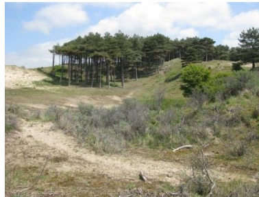
„Sacred Grove“ Kennemerduinen

dat het „productieproces“ gevaar loopt. Tot slot wordt het steeds duidelijker, dat de kern van de huidige problemen op het spirituele vlak ligt. Het is het ego, dat zich ongeremd opblaast, waardoor egoïsme, eenzaamheid, zinloosheid, (existentiële) angst, maatschappelijke chaos en natuurvernietiging logarithmisch toenemen. Inmiddels verkeert de wereld in een nog nooit eerder vertoonde permanente crisis.