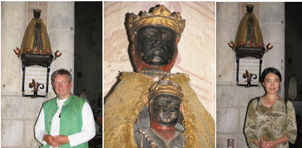
Zwarte Madonna van Thuret, Frankrijk