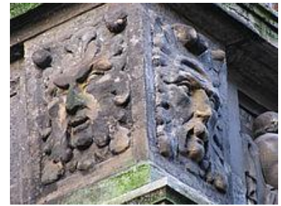
Groene Mannen, Den Haag

door de culturele context, waarvan het deel uitmaakt. Het is overduidelijk Europees georiënteerd. De Kosmische Moeder maakt – via de Zwarte Madonna – deel uit van een Europese erfenis. Vooral in Frankrijk, Spanje, Italië, Duitsland, Oostenrijk, Tsjechië, Zwitserland, België heeft Zij overal Haar kerken en kapellen. Oorspronkelijk openbaarde Zij zich echter in de natuur direct aan de mensen zelf (niet aan de klerus). Wij willen die oorspronkelijke relatie herstellen. Daarnaast ondervindt ons Pelgrimsoord een geweldige opwaardering, doordat het tevens deel is van het „Europese Groene Man & Wijze Vrouw Pelgrims Netwerk“. In de laatste jaren heb ik in 16 Europese landen een (foto) dokumentatie gemaakt (met honderden fotos, te bewonderen in mijn website) (P.S. aangevuld met dito foto’s uit verschillende aziatische landen), dermate vernieuwend, dat we een UNESCO-erfgoedstatus aanvraag overwegen. De intensieve interactie met de educatief-culturele context geeft aan ons Pelgrimsoord een ongeëvenaarde stevigheid.