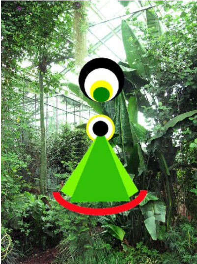
Helende Kosmische Moeder Schrijn

(Jezelf genezen, elkaar genezen, de wereld genezen)