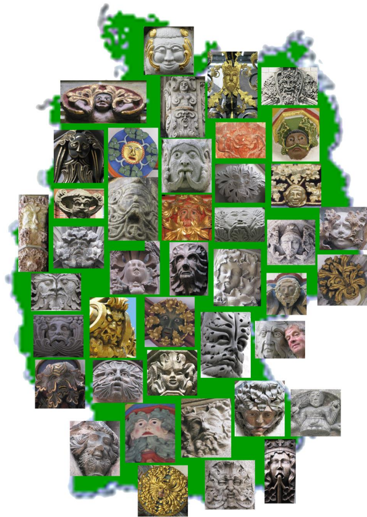
Grüne Männer von Deutschland