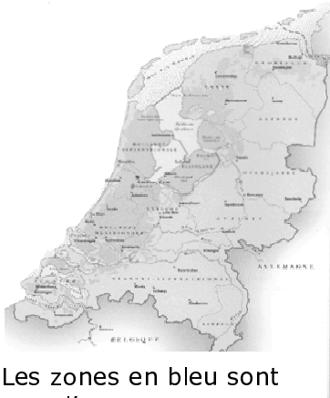
Les zones en bleu sont sous l'eau