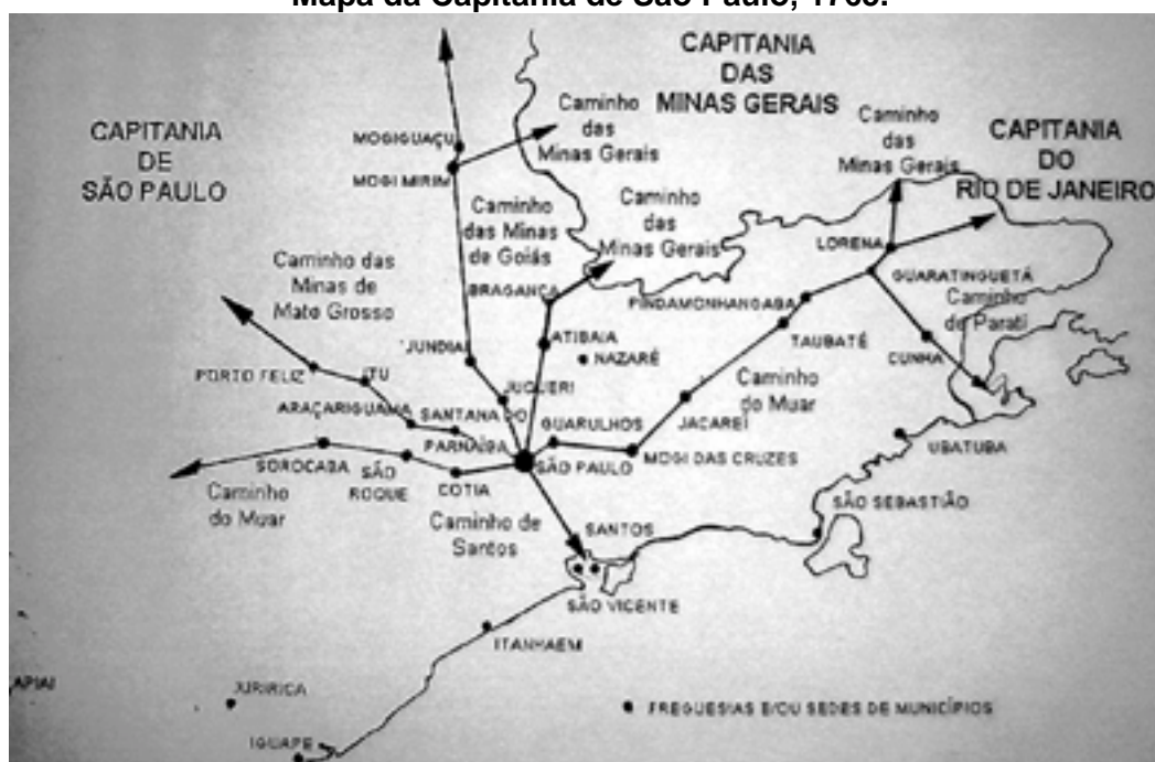
MAPA 1 Mapa da Capitania de São Paulo, 1765.

O resultado da política iniciada pelo Morgado de Matheus para a capitania de São Paulo foi de uma transformação socioeconômica muito significativa, com o surgimento de novos núcleos populacionais e a passagem de uma economia baseada na agricultura de subsistência à exportação de açúcar. Para ilustrar esta situação basta vermos, pelos recenseamentos, que até 1769 o chamado Oeste Paulista tinha apenas duas vilas, Itu e Jundiá, e que a partir deste ano até 1836, surgiram as vilas de Mogi Mirim, Porto Feliz, Campinas, Piracicaba, Araraquara, Capivari e Franca (Cf. MÜLLER, 1978, pp. 57-66). 8